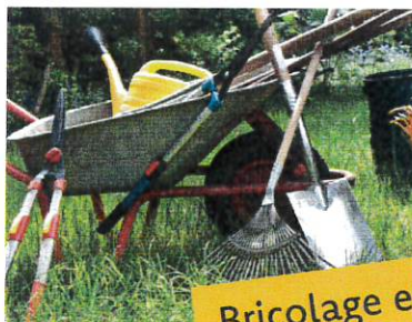
Bricolage et jardin (ABJ)