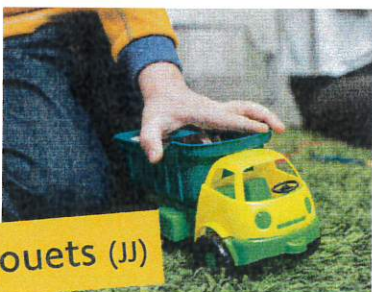
Jeux et jouets (JJ)