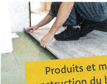
Produits et matériaux de construction du bâtiment (PMCB)