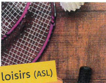
Sport et loisirs (ASL)